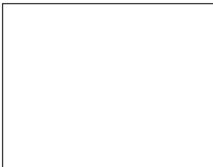
ภาพด้านซ้าย